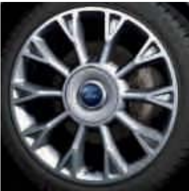
19" kola z lehkých slitin ve stříbrné barvě (Standard pro RS), také dostupné v bílé barvě Frozen (Na přání pro RS)