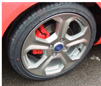
Příplatková kola „Rado Grey“