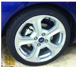
Standardní kola D2YA2